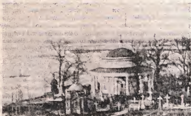
Аскольдова могила — место захоронения П. А. Столыпина

5 сентября П. А. Столыпин умер от ран, нанесенных ему Богровым.